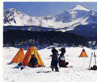
写真(上):07お正月限定 (下):桐電動リール