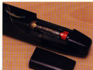
単3電池をセットした総重量が98.5gと非常に軽量にできていますので、ワカサギの感触が良くわかります。